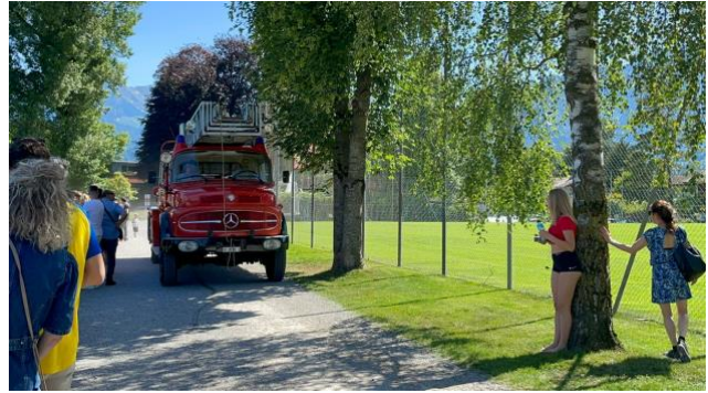
Anfahrt Feuerwehr mit Blaulicht und Horn