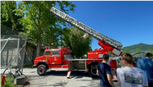
Matchball auf den Platz