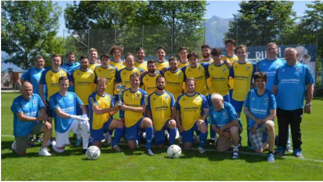
Aufstiegsteam 3./2. Liga im Aufstiegsdress